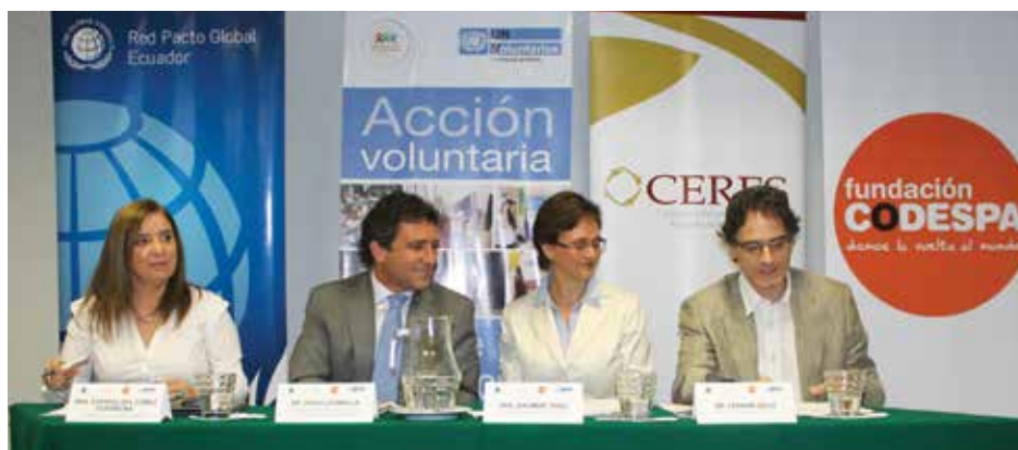
Lanzamiento del Primer Reconocimiento Buenas Practicas de VC/Junio 2014.

El jurado tomo en cuenta para la evaluación de las experiencias una matriz con los siguientes factores y escalas de medición: